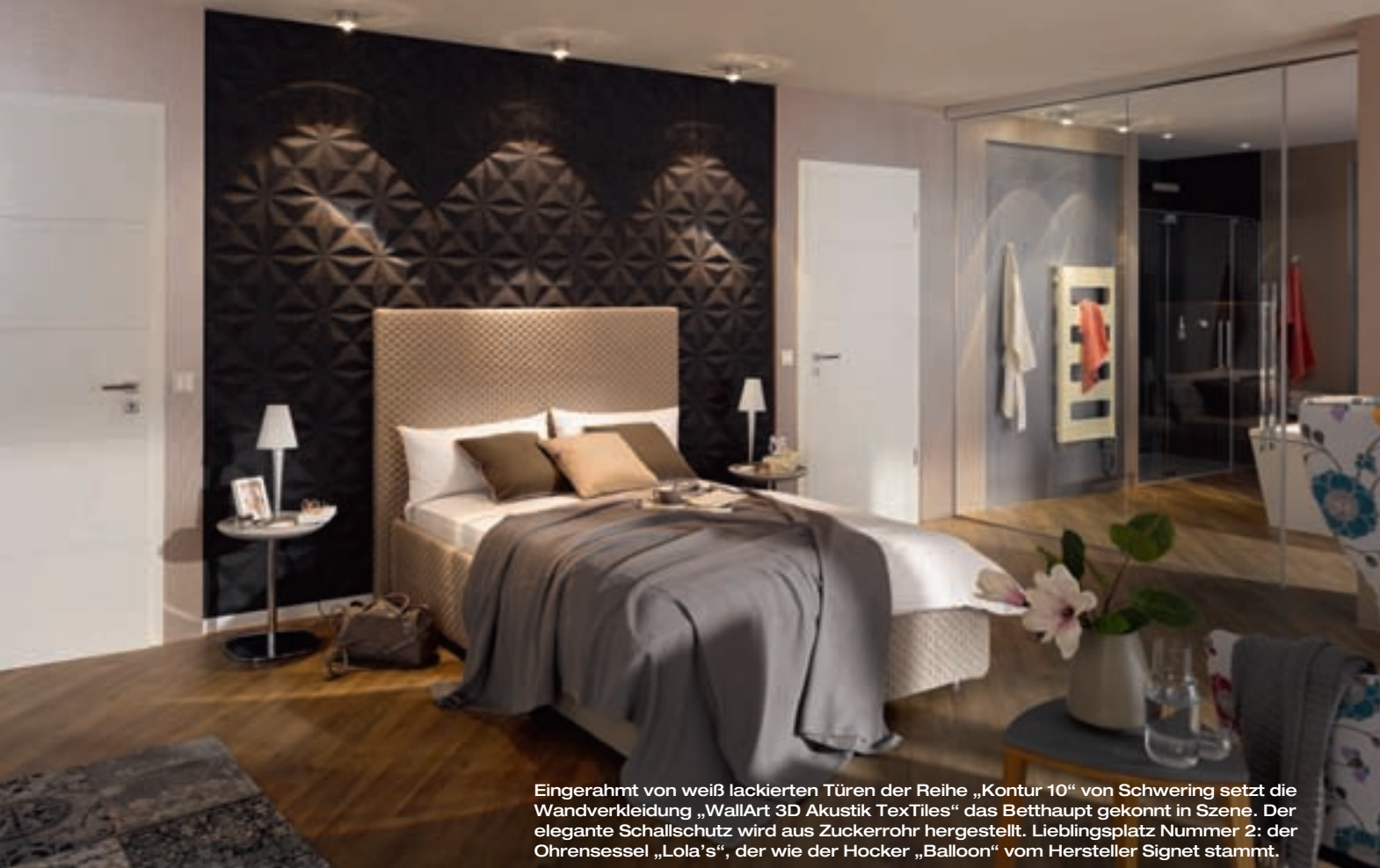
Eingerahmt von weiß lackierten Türen der Reihe „Kontur 10“ von Schwering setzt die Wandverkleidung „WallArt 3D Akustik TexTiles“ das Betthaupt gekonnt in Szene. Der elegante Schallschutz wird aus Zuckerrohr hergestellt. Lieblingsplatz Nummer 2: der Ohrensessel „Lola’s“, der wie der Hocker „Balloon“ vom Hersteller Signet stammt.