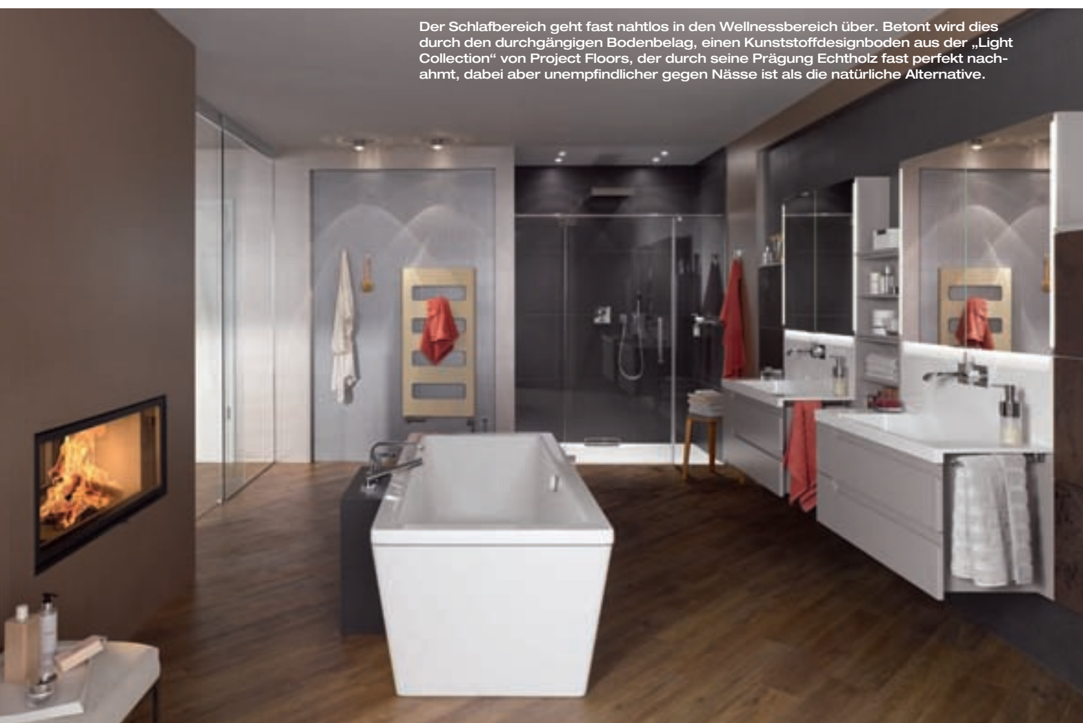
Der Schlafbereich geht fast nahtlos in den Wellnessbereich über. Betont wird dies durch den durchgängigen Bodenbelag, einen Kunststoffdesignboden aus der „Light Collection“ von Project Floors, der durch seine Prägung Echtholz fast perfekt nachahmt, dabei aber unempfindlicher gegen Nässe ist als die natürliche Alternative.